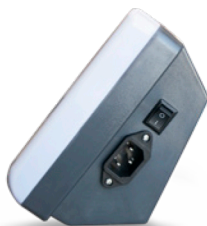
Fuente de alimentación