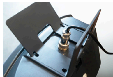
Conexión indicador - plataforma